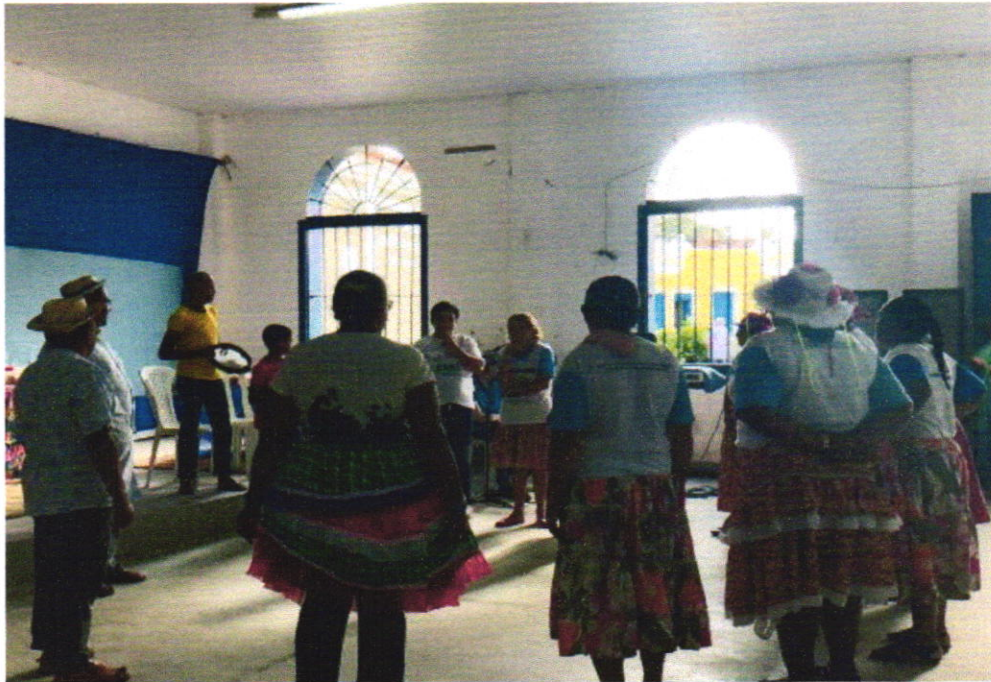
DANÇA DO SCFV - IDOSOS