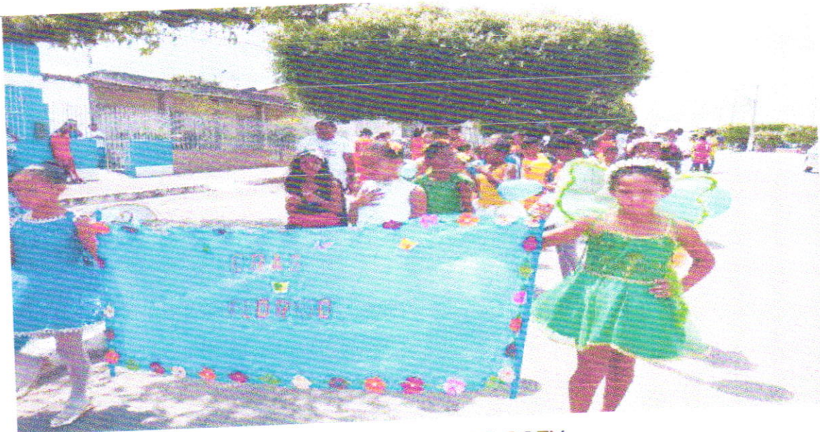
DESFILE CIVICO DO SCFV