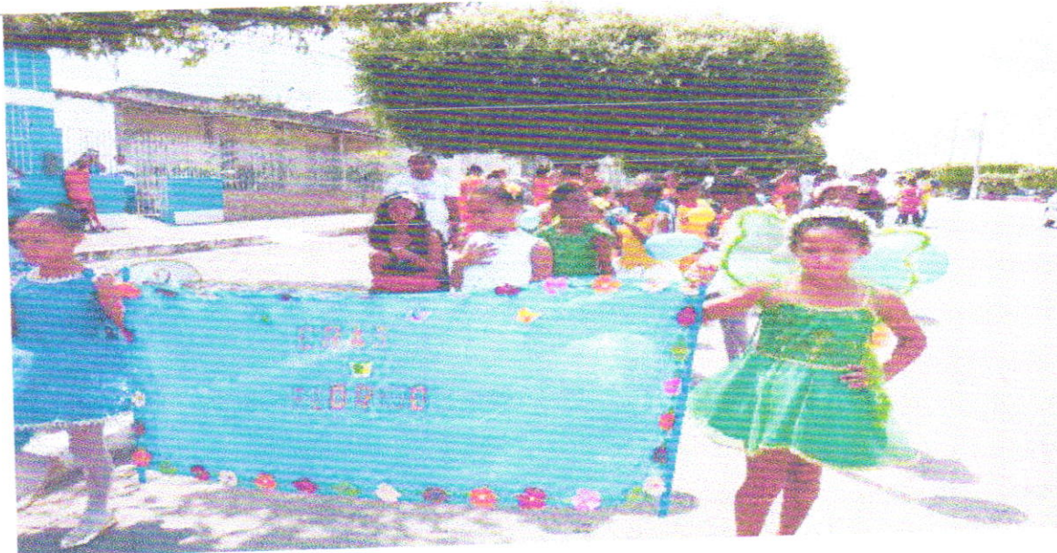
DESFILE CIVICO DO SCFV