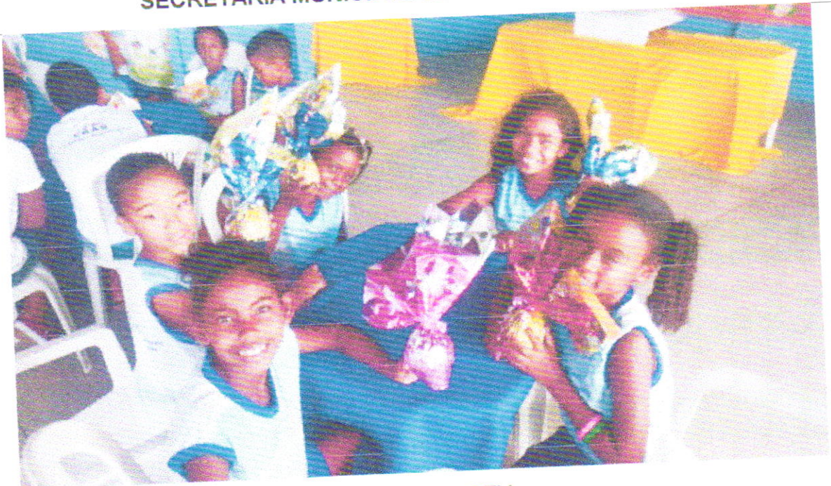
PÁSCOA - SCFV