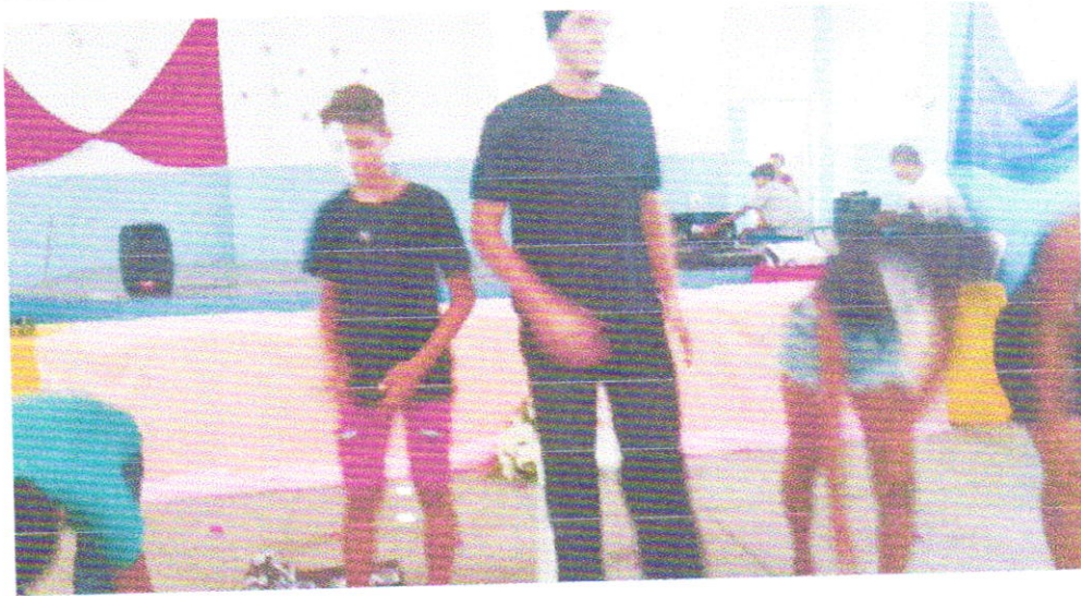
TEATRO DO SCFV