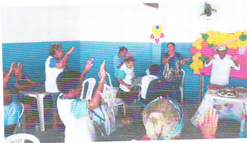
SCFV - IDOSOS