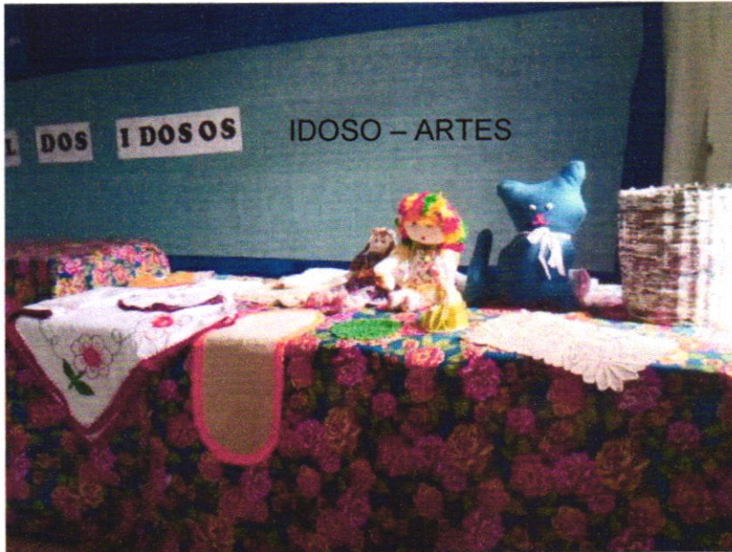
PAIF – INCLUSÃO PRODUTIVA