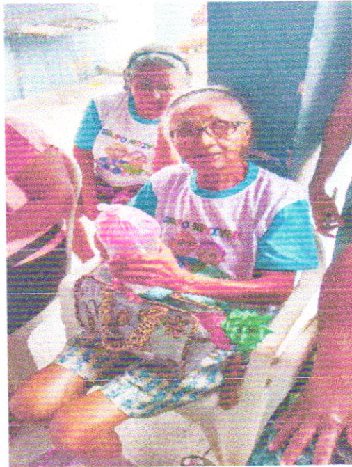
DATA COMEMORATIVA DIA DA MULHER